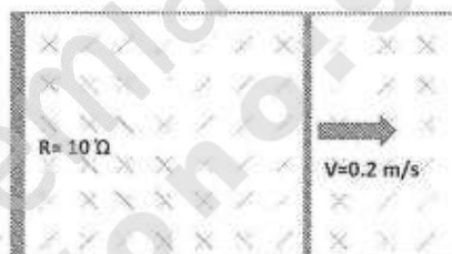
Figura 1: Figure for the problem 1.

A conducting rod slides without friction and with a constant speed of 0.2 \text{ m/s} on two conducting rails that are separated by a distance of 2 \text{ cm} as shown in the figure. All the system is inside a magnetic field perpendicular to the plane containing the rails and the conducting rod. The magnetic field has the sense shown in the figure. For t = 0 the circuit forms a square that has a surface of two square meters. The magnetic field modulus changes with time according to the function B(t) = 6\text{sen}(5t) \text{ T} .