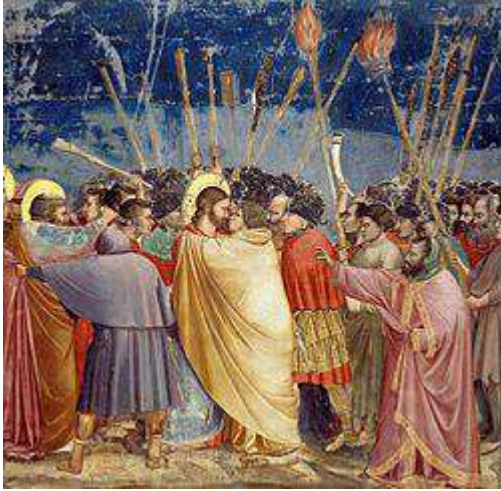
El beso de Judas de Giotto