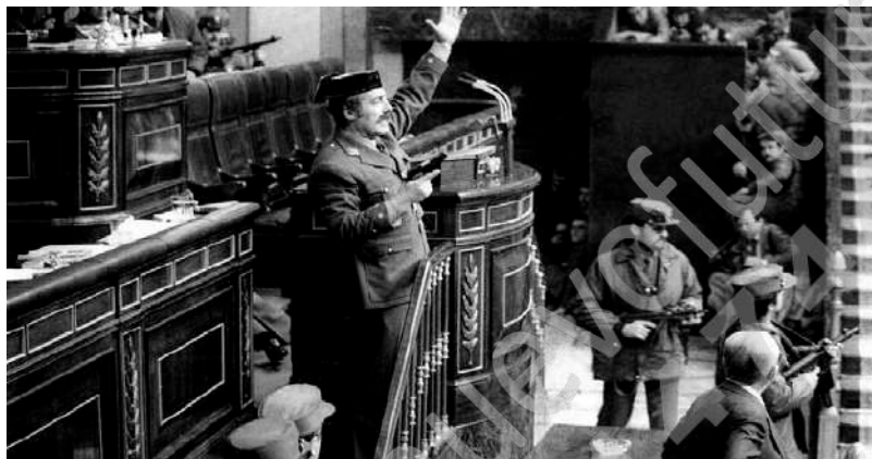
Teniente Coronel Antonio Tejero en el Congreso de los Diputados.