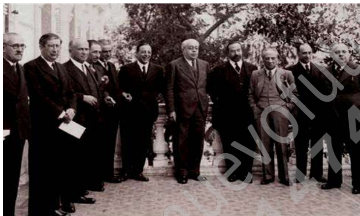
Cuarto gobierno republicano de Manuel Azaña, 1933.

Relacione esta imagen con el bienio reformista (1931-1933) en la Segunda República.