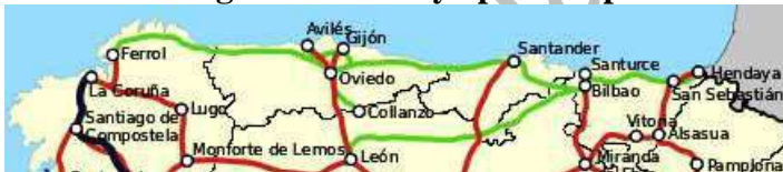
Imagen N° 1. Red actual de ferrocarriles de España