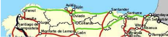
Imagen N° 1. Red actual de ferrocarriles de España

4. Observa este mapa de los ferrocarriles e imagínate que tomas un tren del Ferrol a la localidad gala de Hendaya para responder a las preguntas. (1 punto)